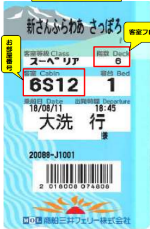
乗船券（ルームカード）

この度は商船三井さんふらわあ「さんふらわあふらの／さっぽろ」をご利用くださいまして、誠にありがとうございます。